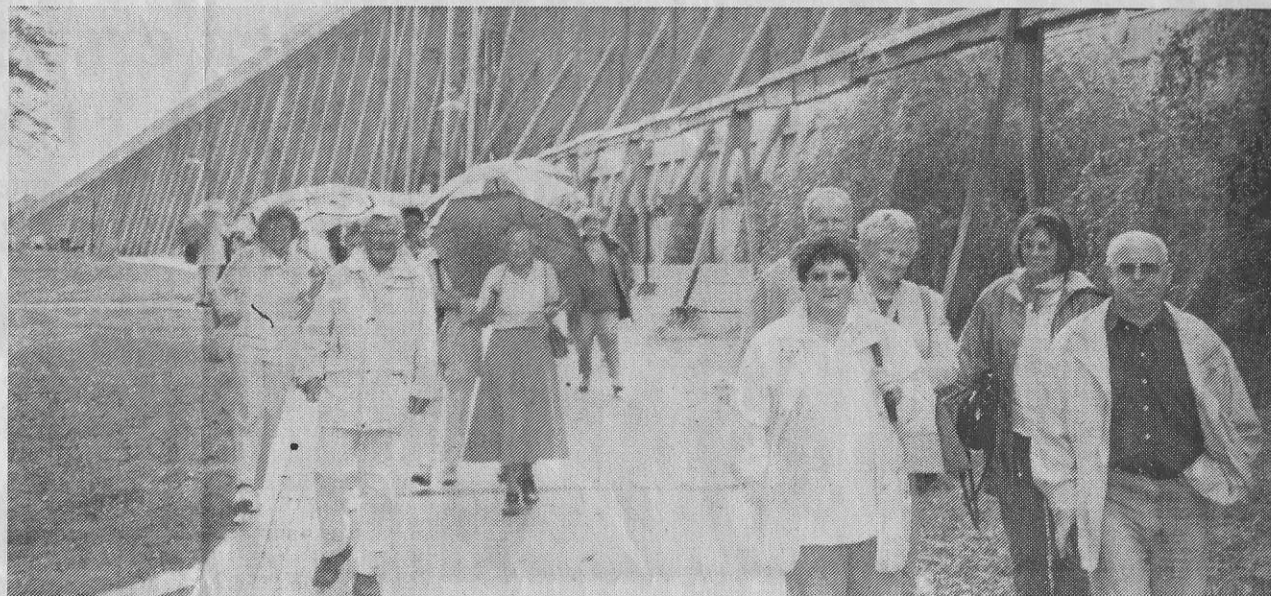
Das riesige Gradierwerk beeindruckte die Niddaer Besucher des Verschwisterungsvereins und des SDW in Bad Kösen